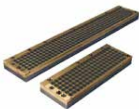
Piano magnetico a campo aperto per metallo duro: Open field high power magnetic chuck for carbide inserts: 用于合金刀片夹持的大功率电磁卡盘