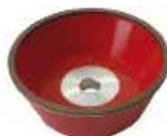
Mola diamantata: Diamond grinding wheel: 金刚石砂轮 D107 D46 D15